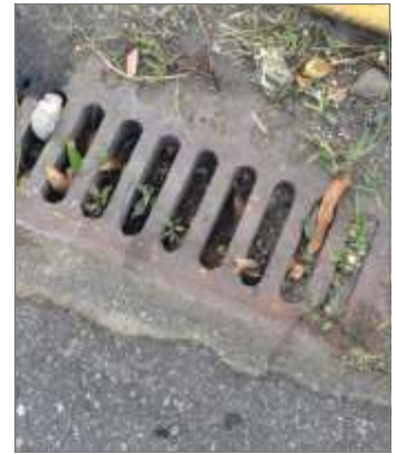
Condición de alcantarillas tapadas en la Calle Estado. ¿Las suyas están igual? ¡Déjanos saber!

El Comité necesita de la cooperación de vecinos residentes en las diversas calles para conocer de primera mano los problemas de infraestructura que históricamente han impactado.