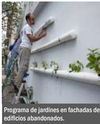
Programa de jardines en fachadas de edificios abandonados.

Para mejorar nuestro entorno y medio ambiente, la Asociación obtiene representación en las actividades de este importante programa ambiental.